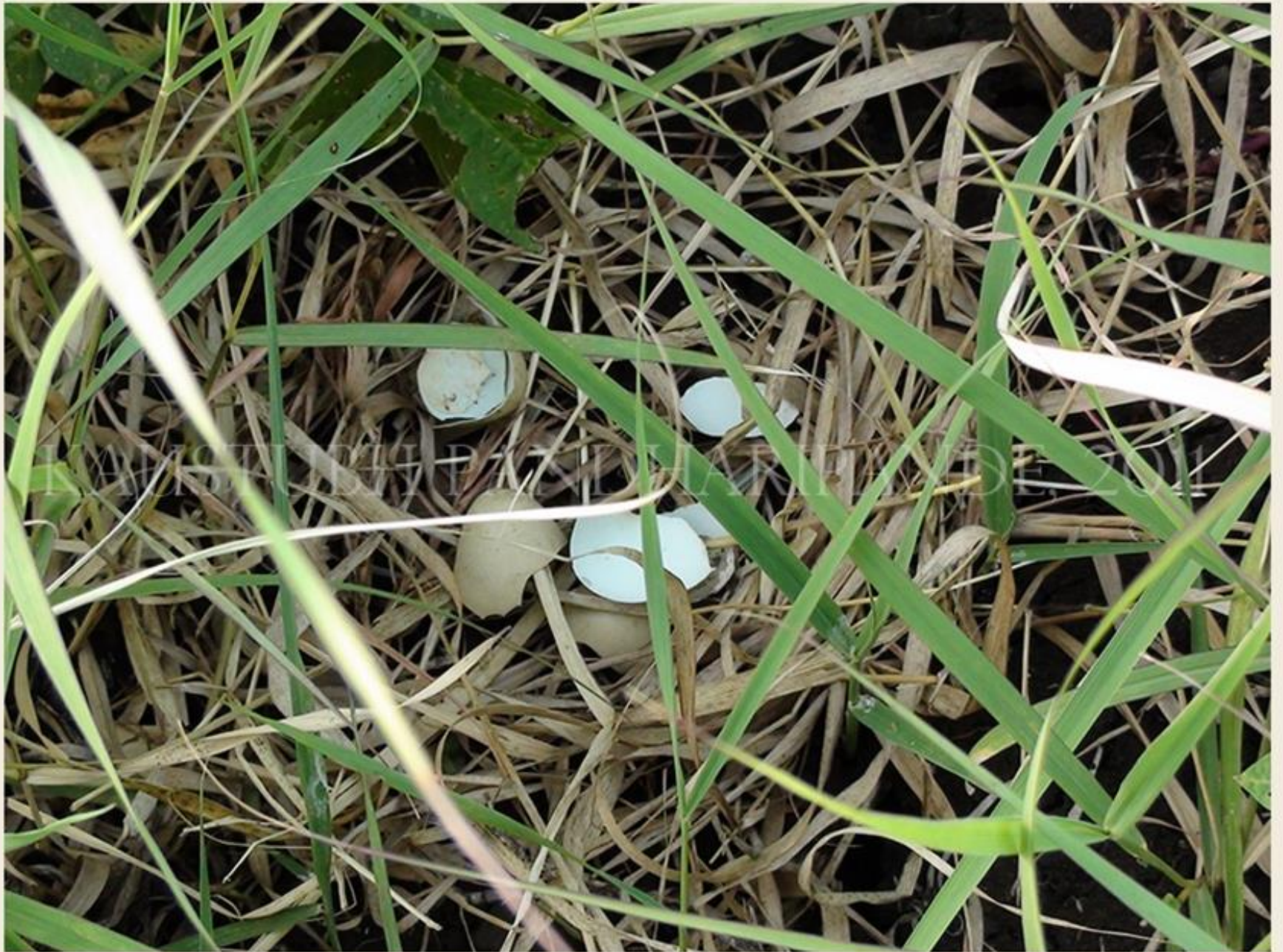
KAUSTUBH PANDHARIPANDE, 2011