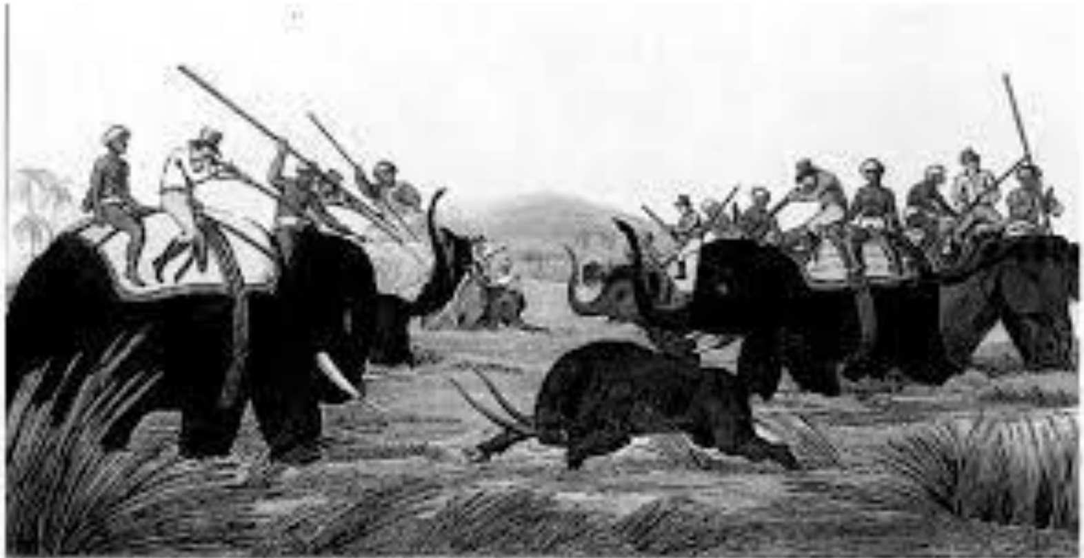
Illustration of a hunt

Published by the British Museum, London, 1853 The British Museum, London